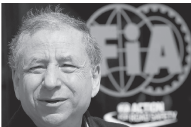
Jean Todtot harmadszor választották meg a Nemzetközi Automobil Szövetség elnökévé

* Részt vesznek a februári, phjongcsiangi téli olimpián az orosz sportolók, akik a Nemzetközi Olimpiai Bizottság (NOB) határozata szerint csak semleges zászló alatt versenyezhetnek majd a játékokon. Az indulásról szóló egyhangú döntés tegnap, az úgynevezett olimpiai gyűlésen született meg. Az orosz dopingbotrány miatt a NOB végrehajtott bizottsága múlt kedden felfüggesztette az Orosz Olimpiai Bizottságot, ezzel egyben kizárta a dél-koreai játékokról, és csak semlegesként, az ötkarikás zászló alatt engedélyezte az orosz sportolók indulását.