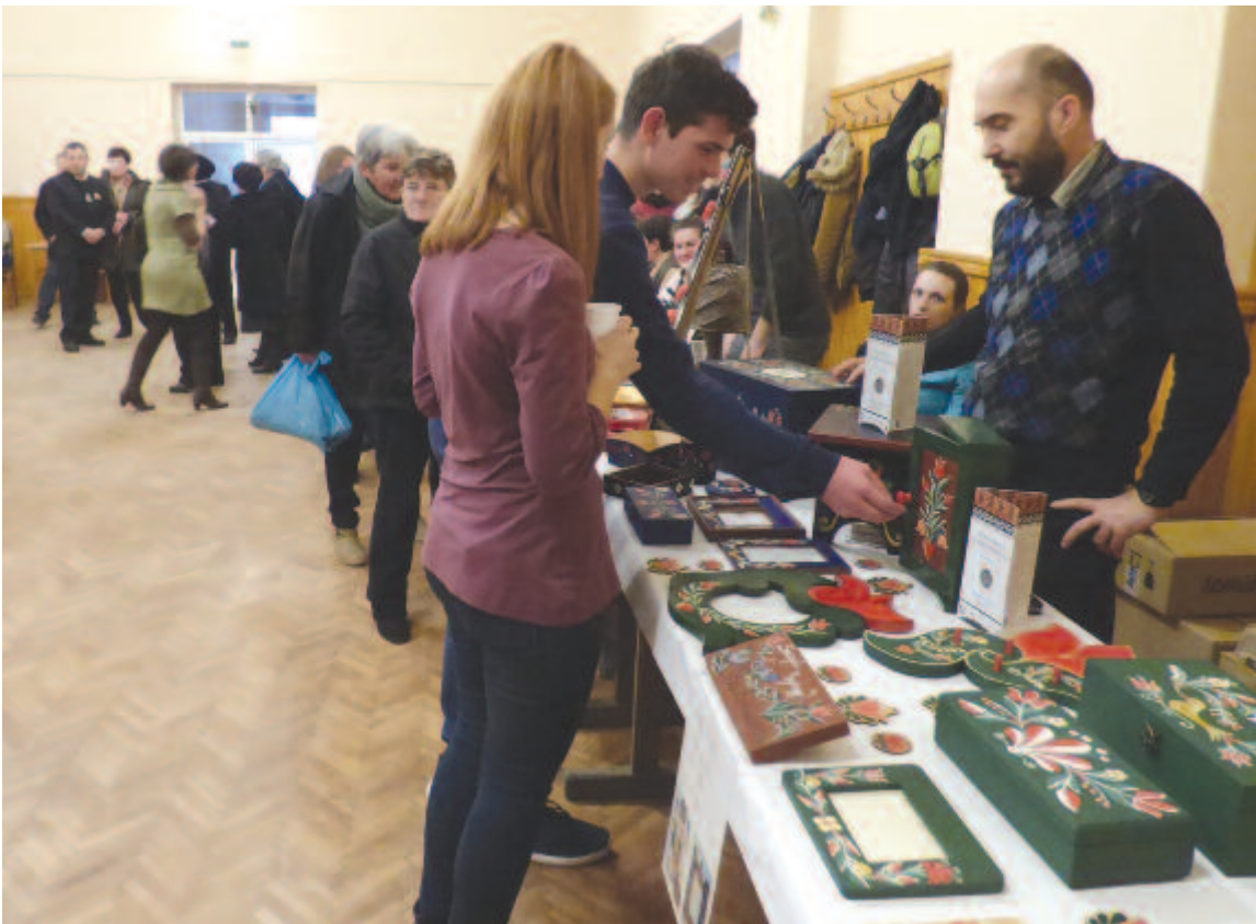
Sokan meglátogatták az első madarasi vásárt